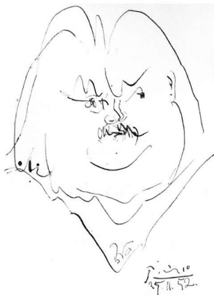
Pablo Picasso, Portrait de Balzac , Frontispiz für Honoré de Balzac, „Le Père Goriot“, 1952, Lithographie, © Succession Picasso / VG Bild-Kunst, Bonn 2017

Zur Ausstellung „Pablo Picasso und die Literatur“ bietet die Kunsthalle Göppingen ein vielseitiges Begleitprogramm für Erwachsene, Jugendliche und Kinder. Die Führungen, Workshops, Lesungen und Vorträge vermitteln einen lebendigen Zugang zu den einzigartigen Werken der Ausstellung.